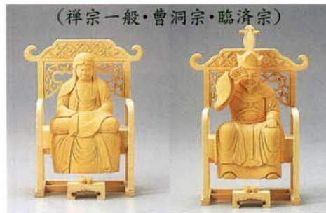
(禅宗一般・曹洞宗・臨濟宗)